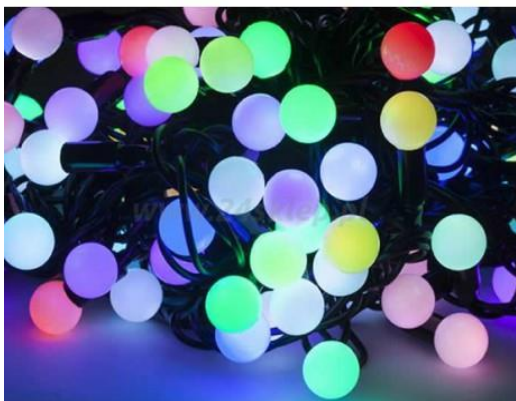
Odp. LAMPKI CHOINKOWE